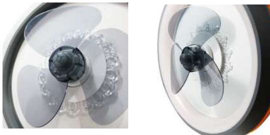
Aspas de acrílico traslucidas.