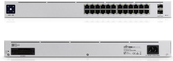
USW-Pro-24-PoE Nivel de ruido*