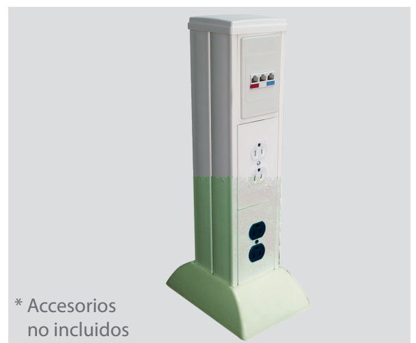
* Accesorios no incluidos