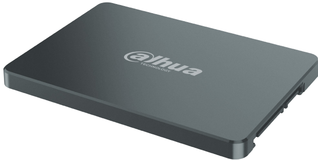
Unidad de estado sólido SATA de 2,5 pulgadas serie V800

Unidad de estado sólido SATA de 2,5 pulgadas