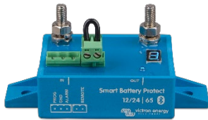
Smart BatteryProtect BP-65