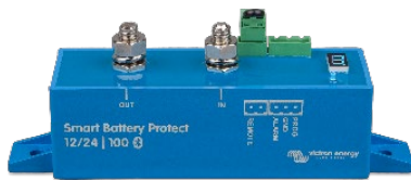
Smart BatteryProtect BP-100