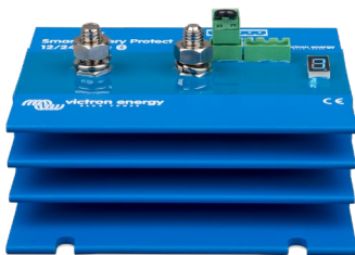
Smart BatteryProtect BP-220