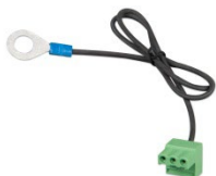
Conector con el cable negativo de CC preensamblado (incluido)