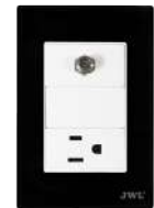
Placa toma TV Coaxial 1 toma corriente JTL-F7648: 10-15A 127V~60Hz