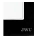
Carcasa acabado Acrílico