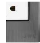
Carcasa acabado Acero