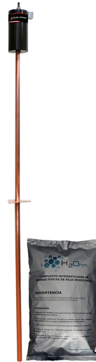
Las imágenes son exclusivamente de carácter ilustrativo y están sujetas a modificaciones.