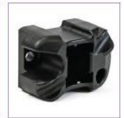
Inserto de protector de palma