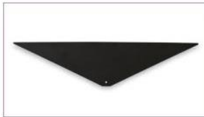
Cubierta de panel angulado