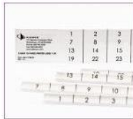
Hojas de etiquetas