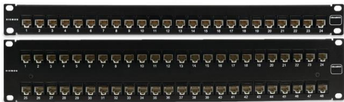
Panel plano de 24 puertos 1U