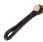
Soporte NMO de 1,91 cm (3/4 in) con cable de 4,3 m (14 ft) (904423)