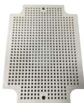
Placa interna (No incluida)