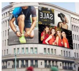
VW Ext. Sobre Pared