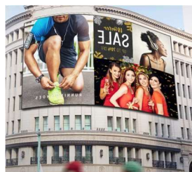
VW Ext. Sobre Pared