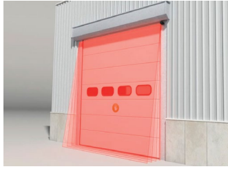
Puertas Automáticas Industriales