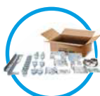
Caja de herrajes con tornillería