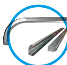
Guías verticales y horizontales