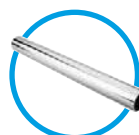
Tubo de torsión