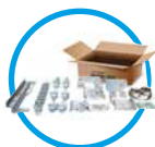
Caja de herrajes con tornillería