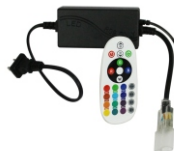
Modelo JLPM-10 Adaptador de Corriente con Control Remoto. 127V~50/60Hz

*Se vende por separado encuéntralo en www.jwjlight.mx o con tu agente de ventas.