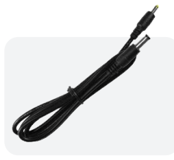
Cable de Salida de Energía