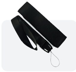
Cordón de Seguridad