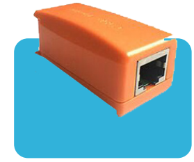
Rastreador de Cables