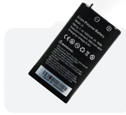
Batería de Litio