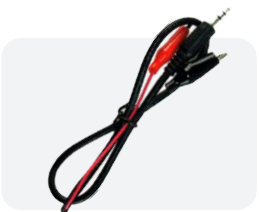
Cable de Prueba de Audio