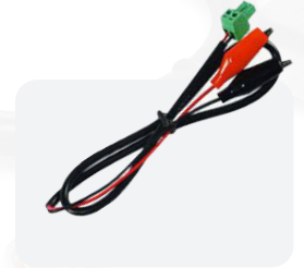
Cable de control RS485