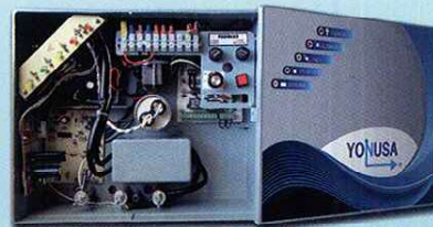
Alta frecuencia EY 10,000-127 AF