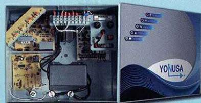
Convencional EY 12,000-127 P