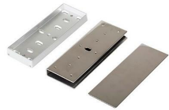
Soporte en U (para Vasopuertas)