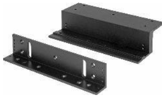
Soporte en Z

Para cerraduras electromagnéticas negras de 600 lb