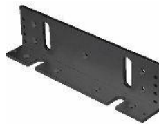
Soporte en L