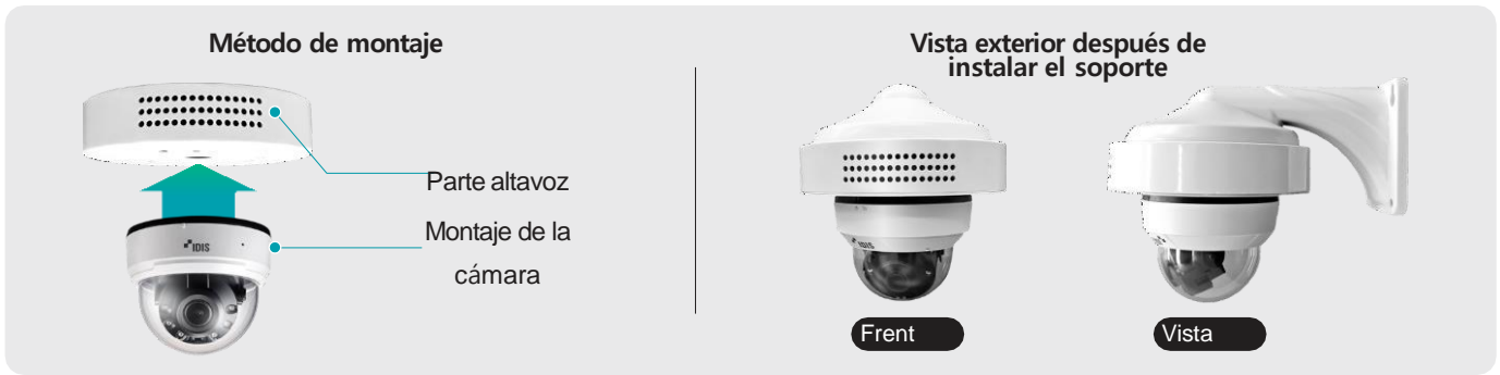
Diagrama del soporte del altavoz IDEAS