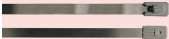
Cincho de acero inoxidable