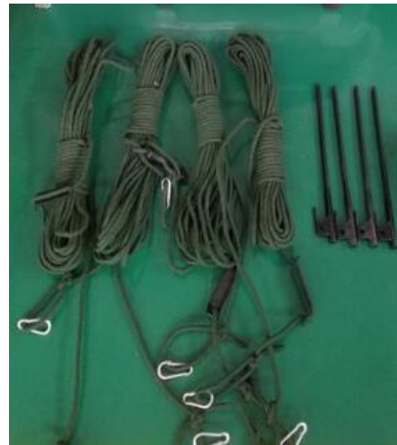
Cable de sujeción.