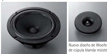
Nuevo diseño de Woofer y Tweeter de cúpula blanda resistentes al agua

óptima alineación temporal entre las dos unidades, lo que permite obtener una correcta imagen sonora. Una guía de ondas y un baffle frontal aseguran una buena dispersión de sonido. La claridad del sonido es excelente en todas las frecuencias, con muy poca distorsión.