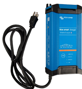
Blue Smart IP22 12/30 (3)