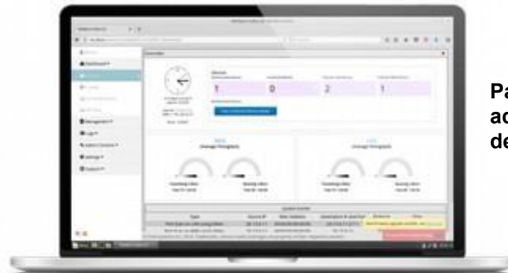
Pantalla de administradores de Authonet F-15