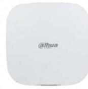
Centro de alarmas