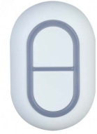
Botón de pánico inalámbrico