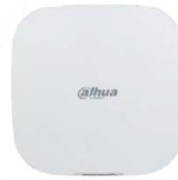
Centro de alarmas