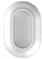
Botón de pánico inalámbrico