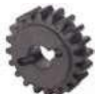
Piñón Z20 cremallera 719167