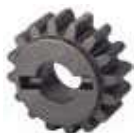
Piñón Z16 cremallera 719130