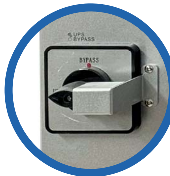
Conmutador de BYPASS de mantenimiento