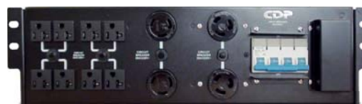
Compatible con unidad de distribución de energía (PDU) se vende por separado