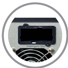
Slot para tarjeta SNMP