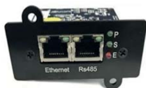
Tarjeta opcional: UPO22 SNMP