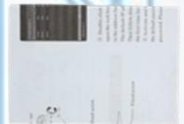
Manual de usuario