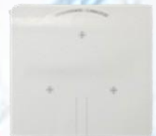
Guía de corte