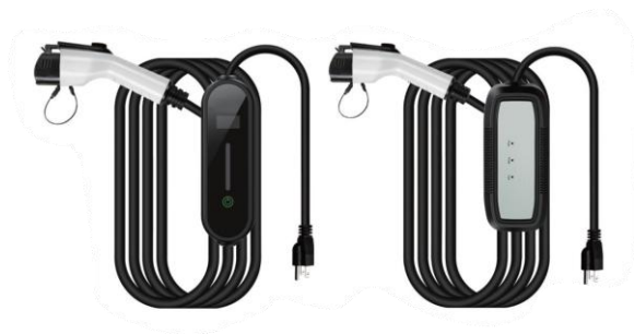
Cargador de viaje portable con conector Tipo 2