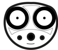
Conector Tesla (hacia auto EV)