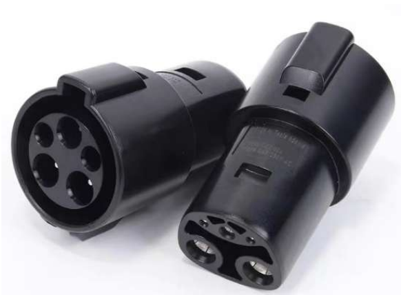
Vistas del adaptador mostrando Tipo 1 y Tesla (solo una pieza incluida)