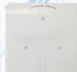
Guía de corte