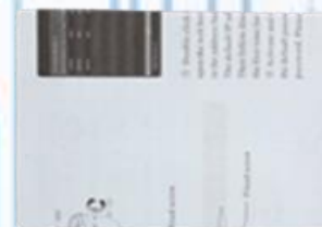
Manual de usuario