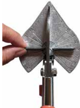
Ángulo de corte ajustable