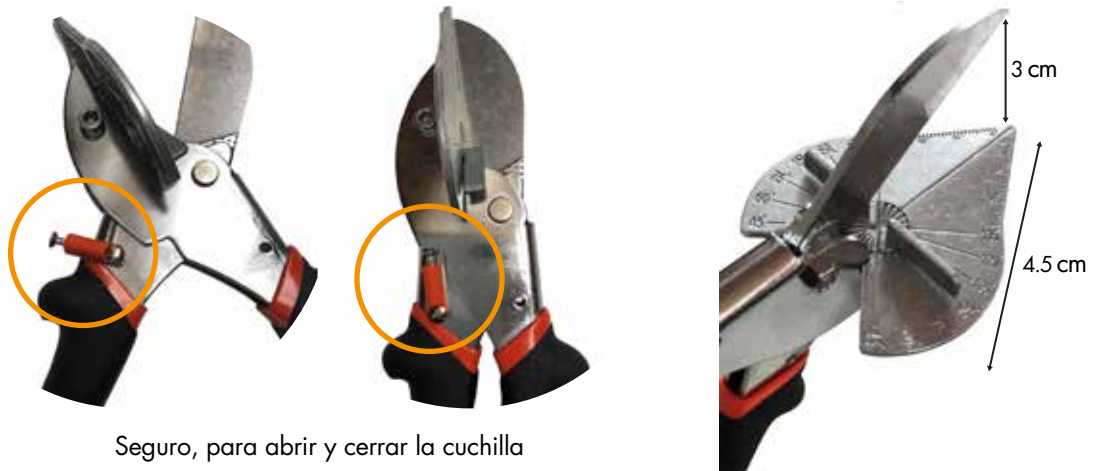
Seguro, para abrir y cerrar la cuchilla