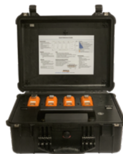
Estación de Funcionalidad Calibración y Pruebas