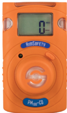
PM 100 -CO

El PM100 es un monitor monogás portátil desechable, no requiere mantenimiento y protege a los trabajadores al detectar la exposición de gases específicos en entornos peligrosos. El PM100 monitorea continuamente las condiciones del aire ambiental e indica concentraciones de gas en tiempo real en una pantalla LCD de fácil lectura. Un sistema de alarma de tres niveles advierte al usuario de la presencia de niveles de gas inseguros con alarmas sonoras, visuales y vibratorias. El PM100 tiene opciones de sensor para monóxido de carbono (CO), sulfuro de hidrógeno (H 2 S), oxígeno (O 2 ), amoníaco (NH 3 ) y dióxido de azufre (SO 2 ).