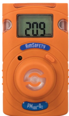
PM 100 -O 2