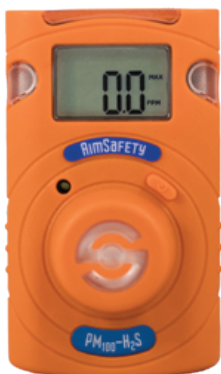
PM 100 -H 2 S