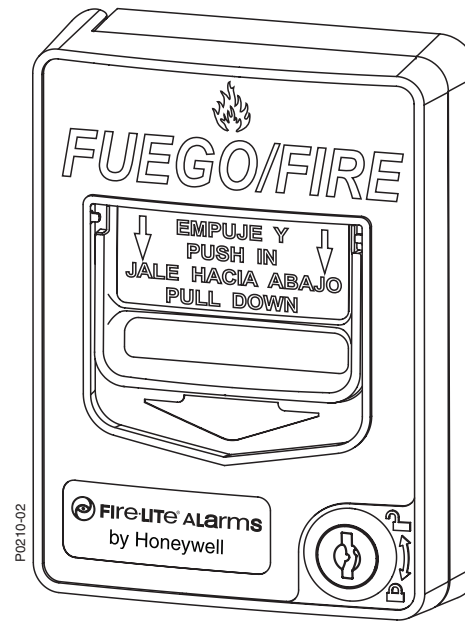
BG-12LSP Estación Pulsadora Manual

NOTA: Al cerrar la puerta el interruptor es reajustado automáticamente a la posición 'Normal'. El abrir la puerta de la estación no activará o desactivará el interruptor de la alarma.